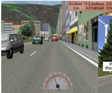
Ihr Firmenlogo und Ihre ganz