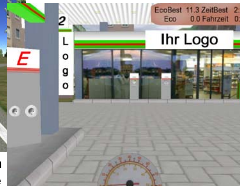
Simulation ein. Nutzen Sie unsere Simulation für Ihre ganz persönliche Kundenattraktion!

bis zur nächsten Elektrotankstelle und dann noch viel weiter.